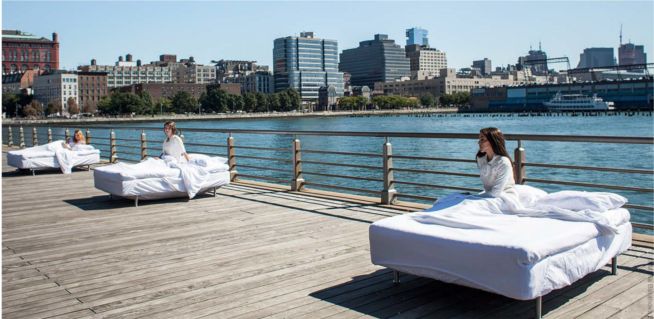
Crossing The Line Festival, New York, United States