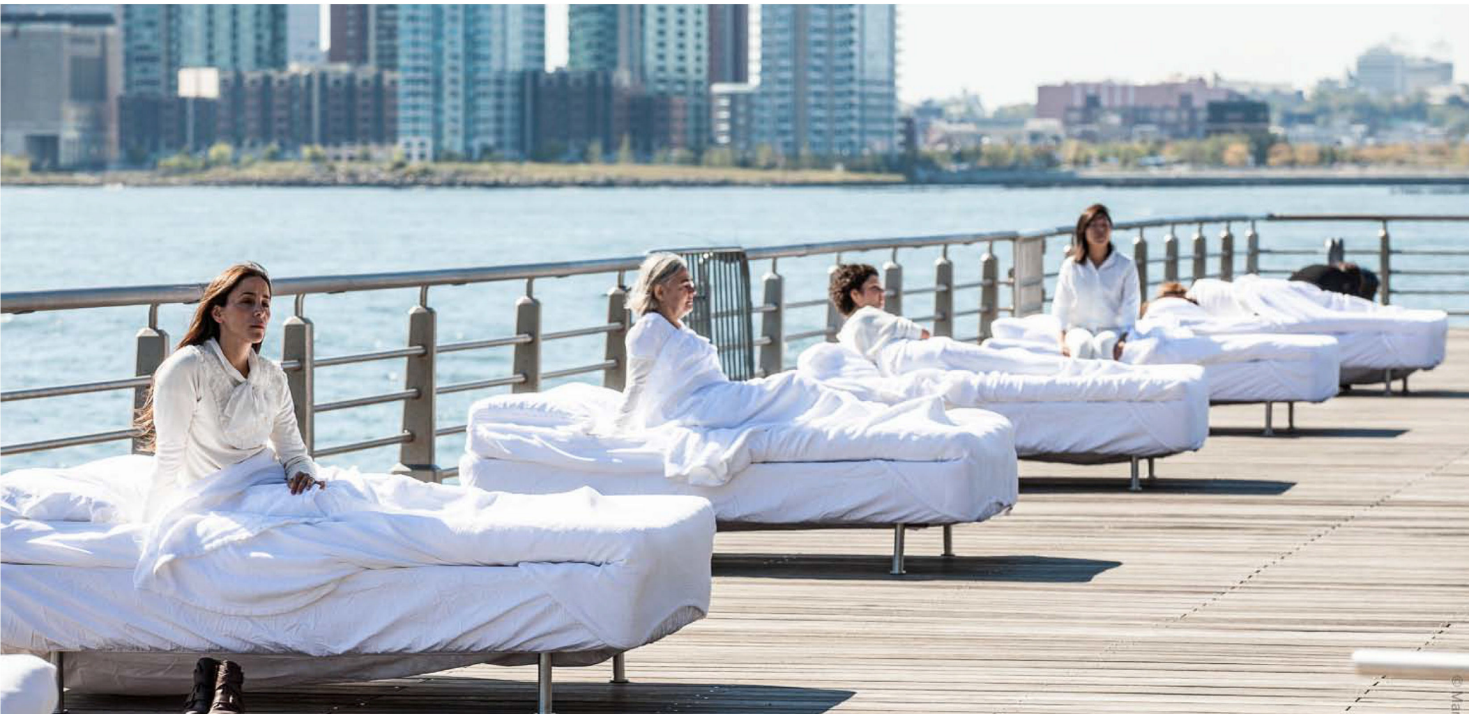
Crossing The Line Festival, New York, United States