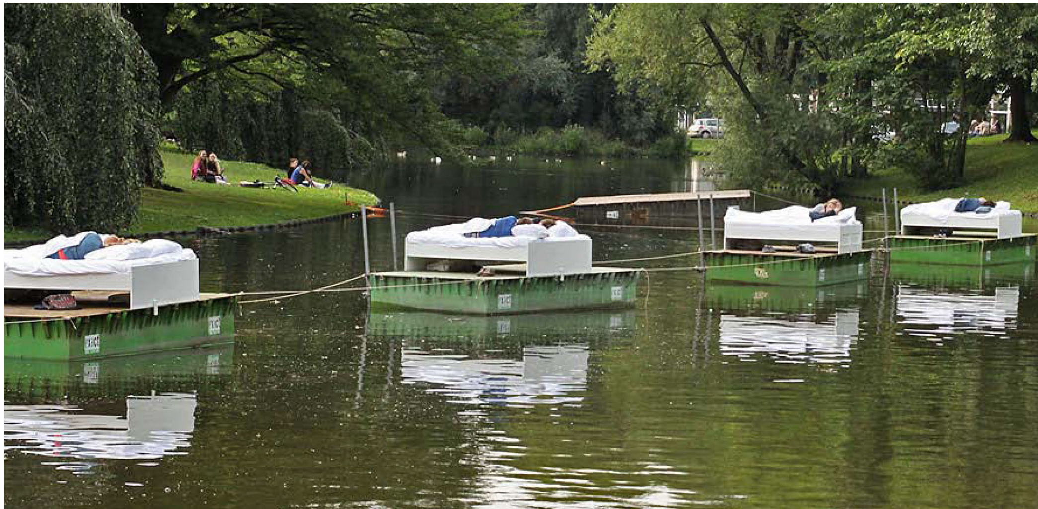
Noorderzon Performing Arts Festival, Groningen, Holanda