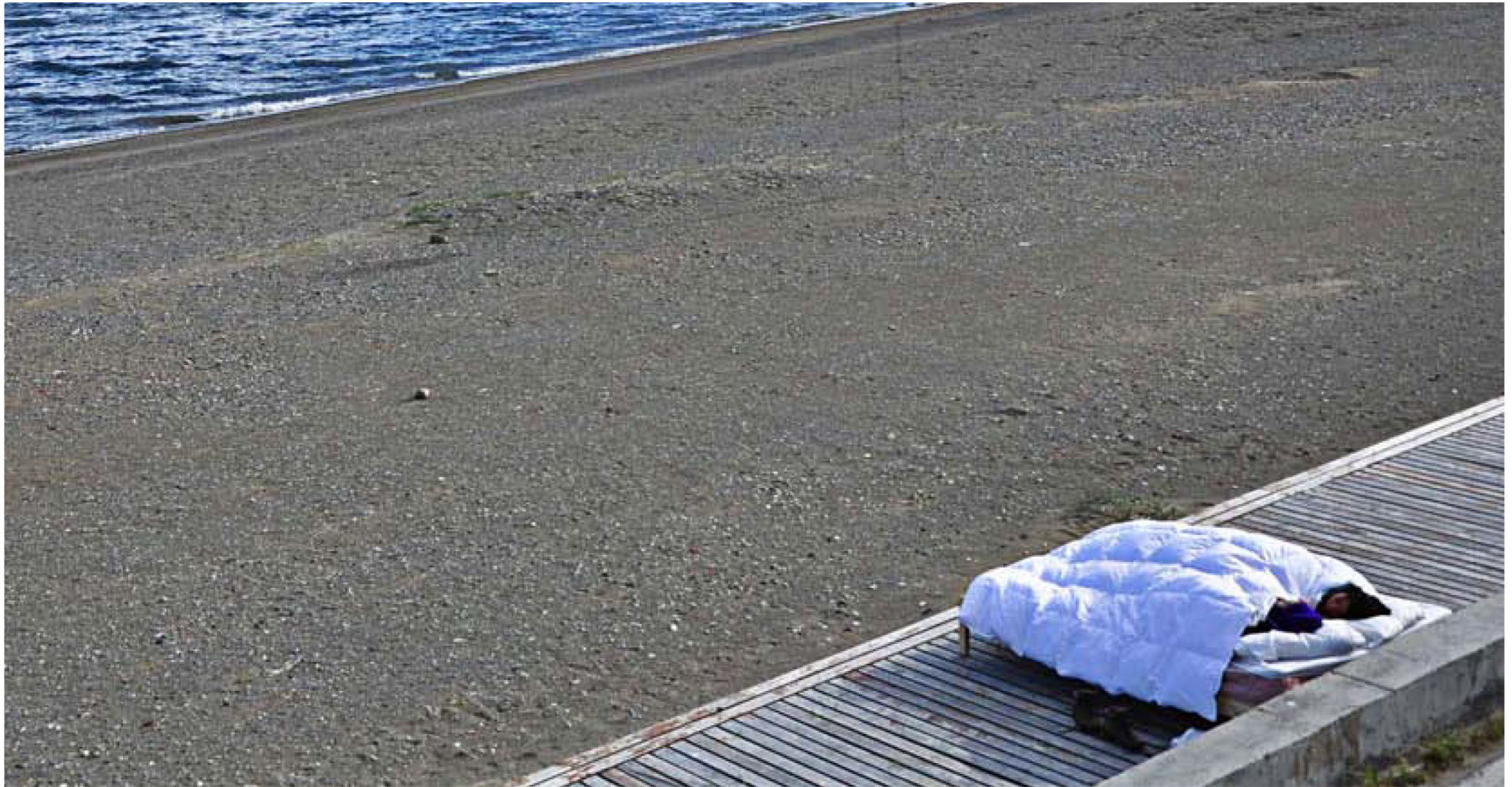
Festival Cielos Del Infinito, Punta Arenas, Chile