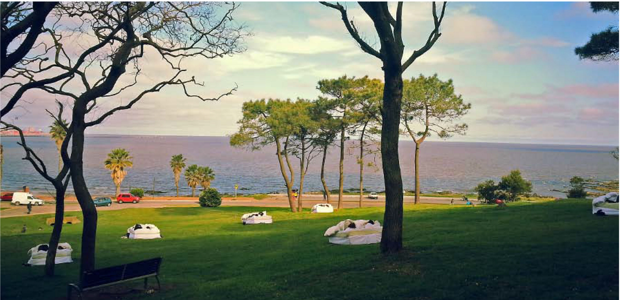
Fidae Festival Internacional De Artes Escénicas. Montevideo, Uruguay