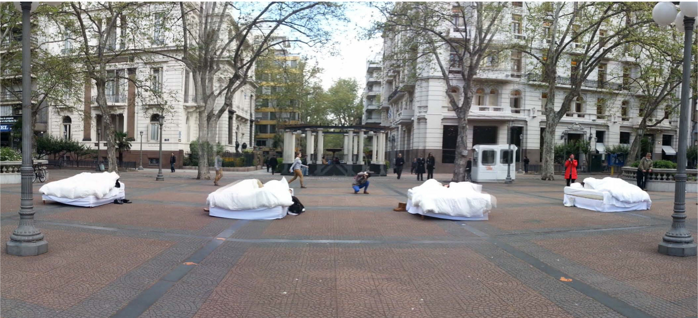
Fidae Festival Internacional De Artes Escénicas. Montevideo, Uruguay